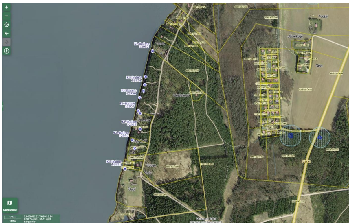
Lisa 1. Kivikalmete reg-nr 12948-12950, 12952-12955 punktisymboliga tähistatud asukohad Maa-ameti kultuurimälestiste kaardikihil seisuga 01.03.2024. (Alus: Maa-ameti geoportaali kultuurimälestiste kaardikiht)