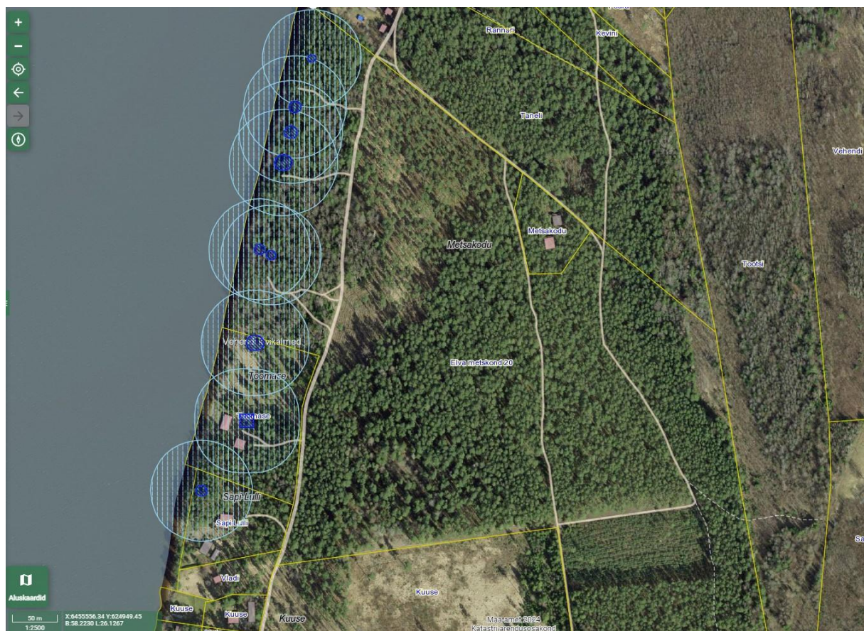
Lisa 3. Kivikalmete reg-nr 12948-12950, 12952-12955 asukohad, ruumikujud ja kaitsevööndid Maa-ameti kultuurimälestiste kaardikihil seisuga 13.03.2024. (Alus: Maa-ameti geopraali kultuurimälestiste kaardikiht)